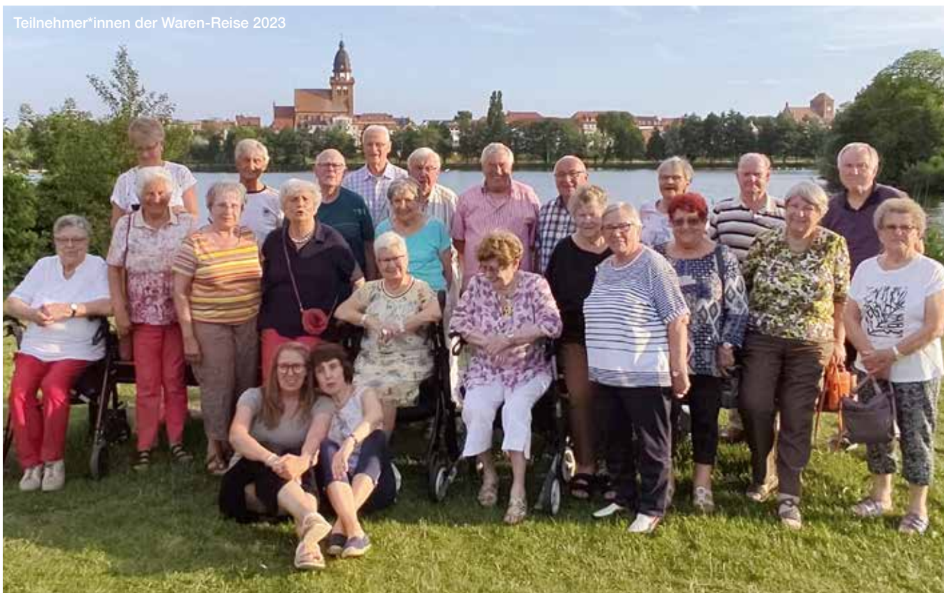
Teilnehmer*innen der Waren-Reise 2023

Im Unterschied zu Reiseangeboten der kommerziellen Reisebüros werden unsere Erholungsaufenthalte von Ehrenamtlichen begleitet. Diese sind im Auftrag der Caritasverbände Ansprechpartner*innen für die Teilnehmenden, sie unterstützen die Reisegruppe und geben im Einzelfall Hilfestellung bei Not- oder Krankheitsfällen. Darüber hinaus organisieren die Reisebegleiter*innen ein abwechslungsreiches Freizeitprogramm und sorgen für einen möglichst reibungslosen Ablauf der Reise. Auf ihre Aufgaben werden unsere Ehrenamtlichen durch Fort- und Weiterbildungen intensiv vorbereitet.